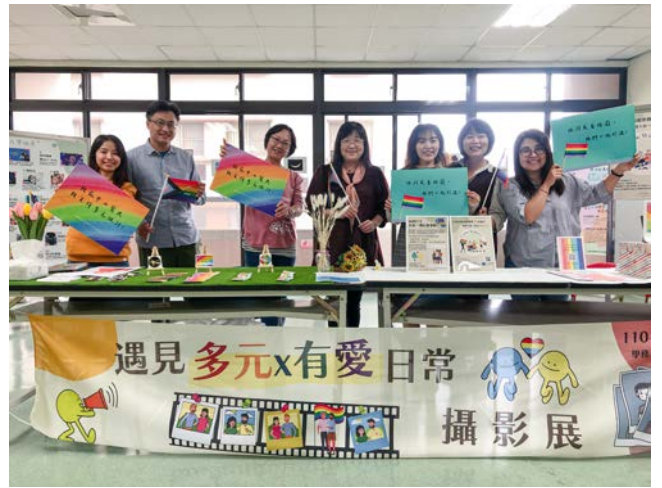
諮輔志工團 / 身健中心心理師大合照