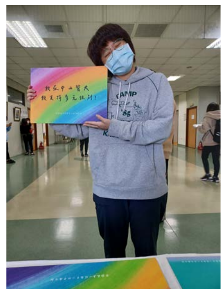
同學響應倡議活動