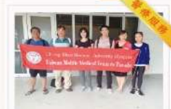
中山附醫派醫療團至吐瓦魯執行醫療任務

中山附醫自2005年起積極參與國際醫療援外任務，長期以來以私立醫院有限的資源，投入國際醫療人道援助。2006年與吐瓦魯瑪格麗特公主醫院締結為姊妹醫院後，每年將派遣臨床醫療小組赴吐國提供醫療援助(例如：皮膚科、骨科、牙科、耳鼻喉科、身心科...等)，並長期代訓吐國醫師與醫事人員，獲得當地民眾及政界人士一致好評。