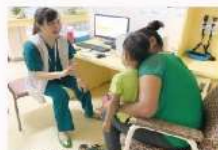
皮膚科門診-皮膚健康照護