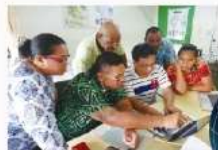
醫療資訊系統(HIS)與網站架設教學