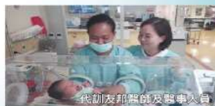
代訓友邦醫師及醫事人員

在「國際衛生醫療合作策略聯盟」(International Health-care Cooperation Strategic Alliance)的架構下，與國合會共同辦理「友好國家醫事人員訓練計畫」，提供友好國家醫事人員訓練與交流。除協助友邦國家醫事人員提升醫療技術與知識、體驗台灣生活與文化外，學員結訓返國後，發揮教學種子的力量，將所學之專業醫療知識、技術及經驗，傳授給更多的當地醫護人員，進一步提升當地醫療人力資源與醫療照護品質，嘉惠更多友邦民眾。