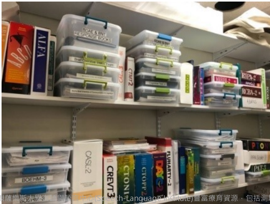
參觀薩樂斯大學言語與語言中心(Speech-Language Institute)豐富療育資源，包括測驗櫃