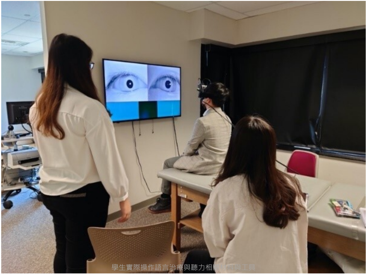
學生實際操作語言治療與聽力相關器材與工具