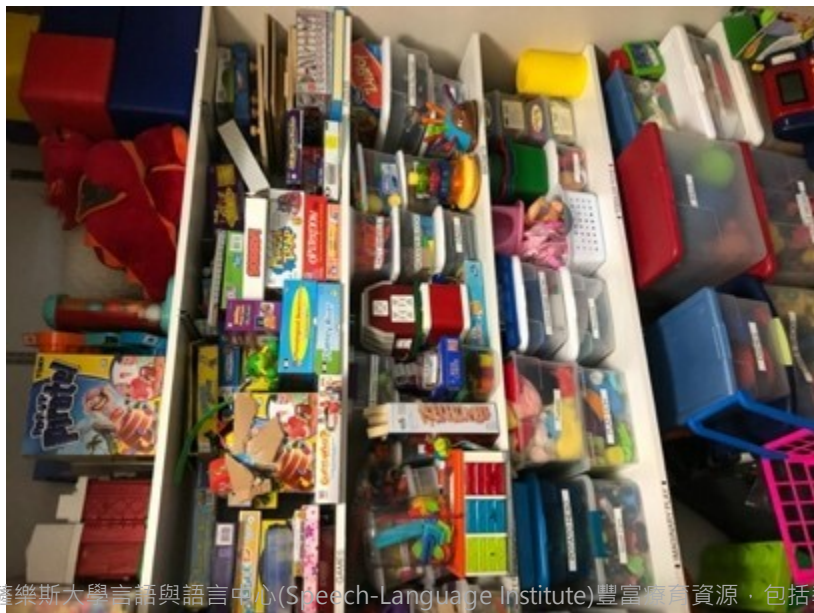
參觀薩樂斯大學言語與語言中心(Speech-Language Institute)豐富體育資源，包括教材櫃