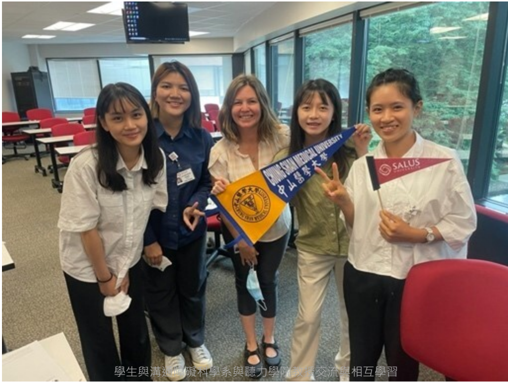
學生與溝通障礙科學系與聽力學院教授交流與相互學習