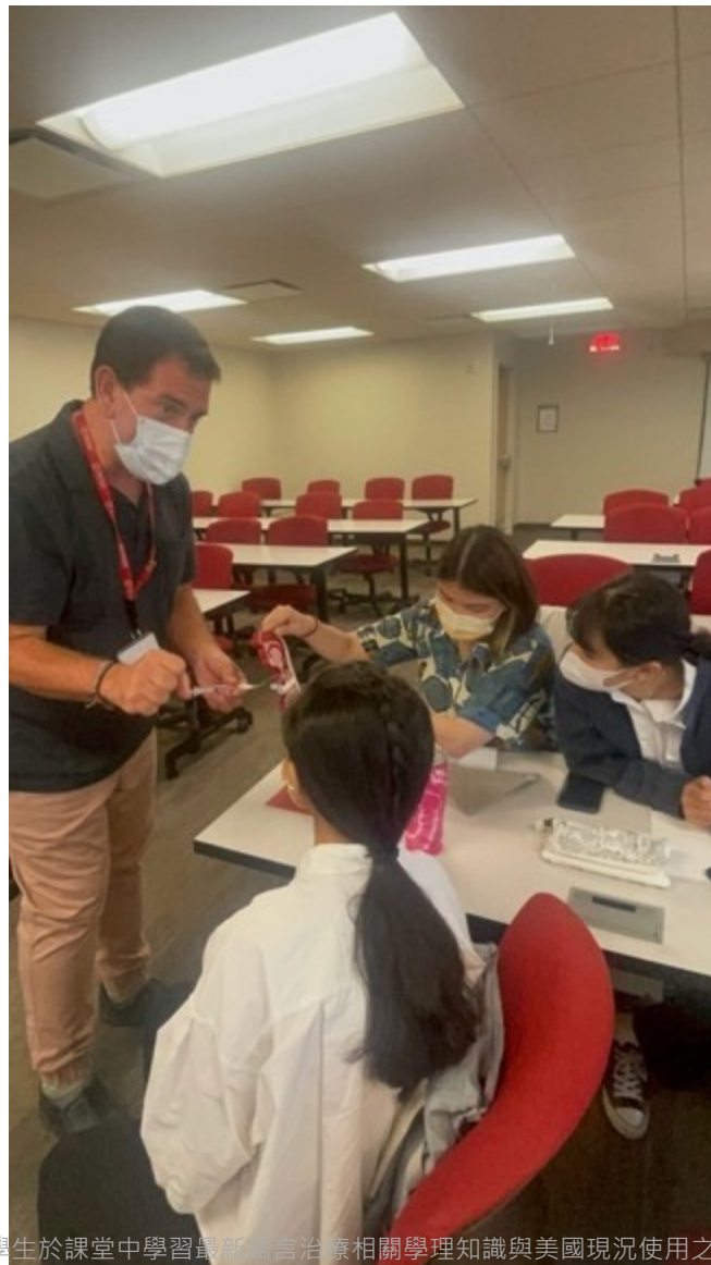
語言組學生於課堂中學習最新語言治療相關學理知識與美國現況使用之評估工具