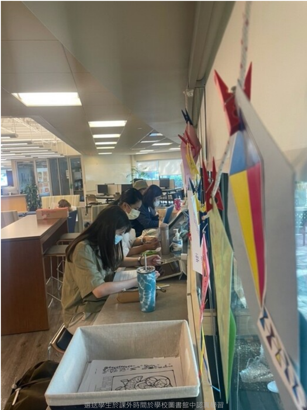
選送學生於課外時間於學校圖書館中認真學習