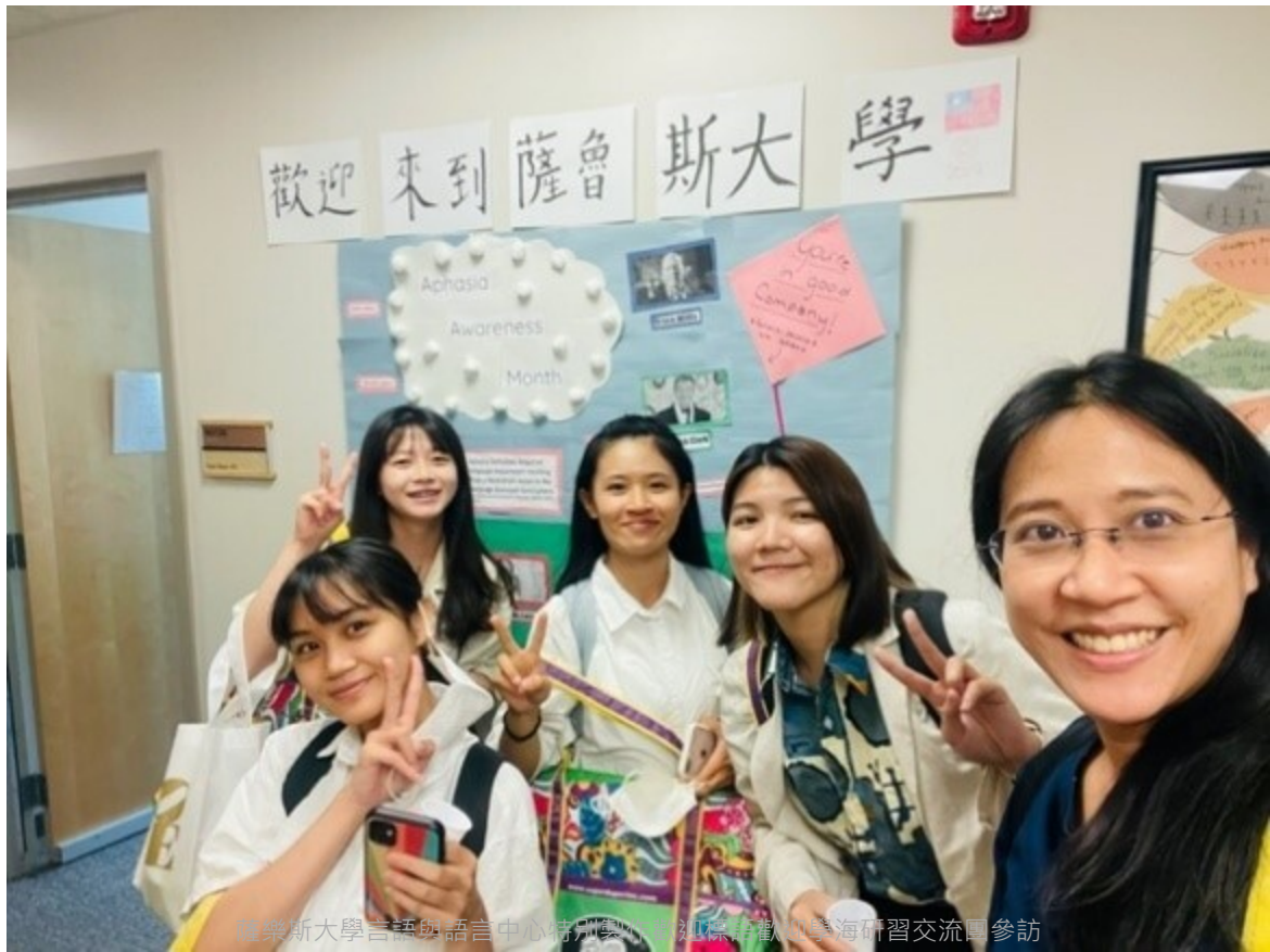
薩魯斯大學言語與語言中心特別製作的歡迎標誌歡迎留學海研習交流團參訪