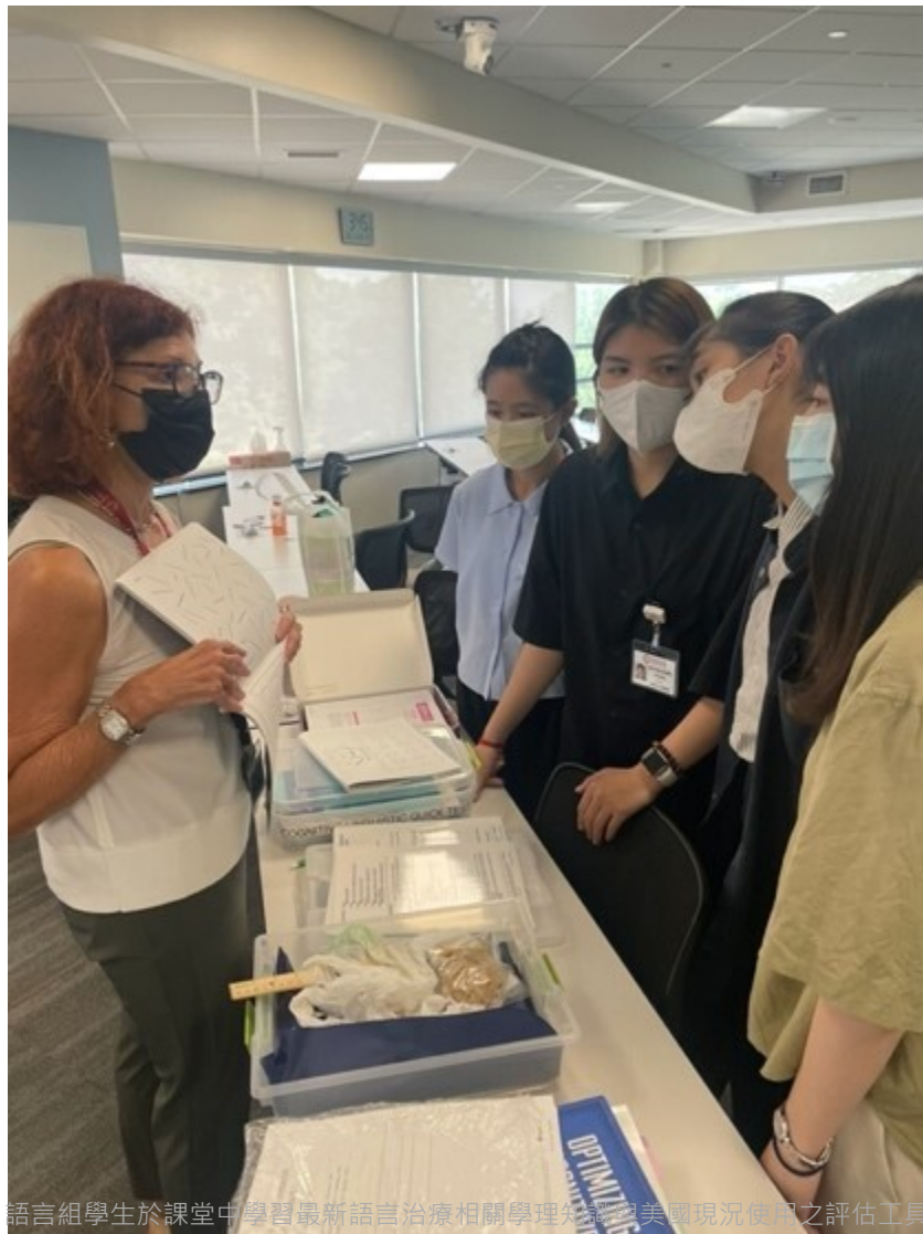
語言組學生於課堂中學習最新語言治療相關學理知識與美國現況使用之評估工具