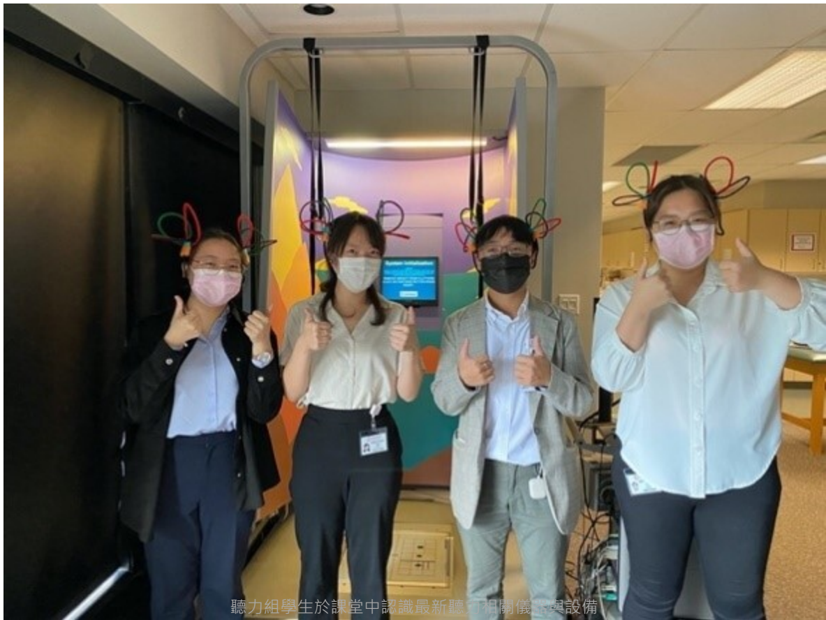
聽力組學生於課堂中認識最新聽打相關儀器與設備