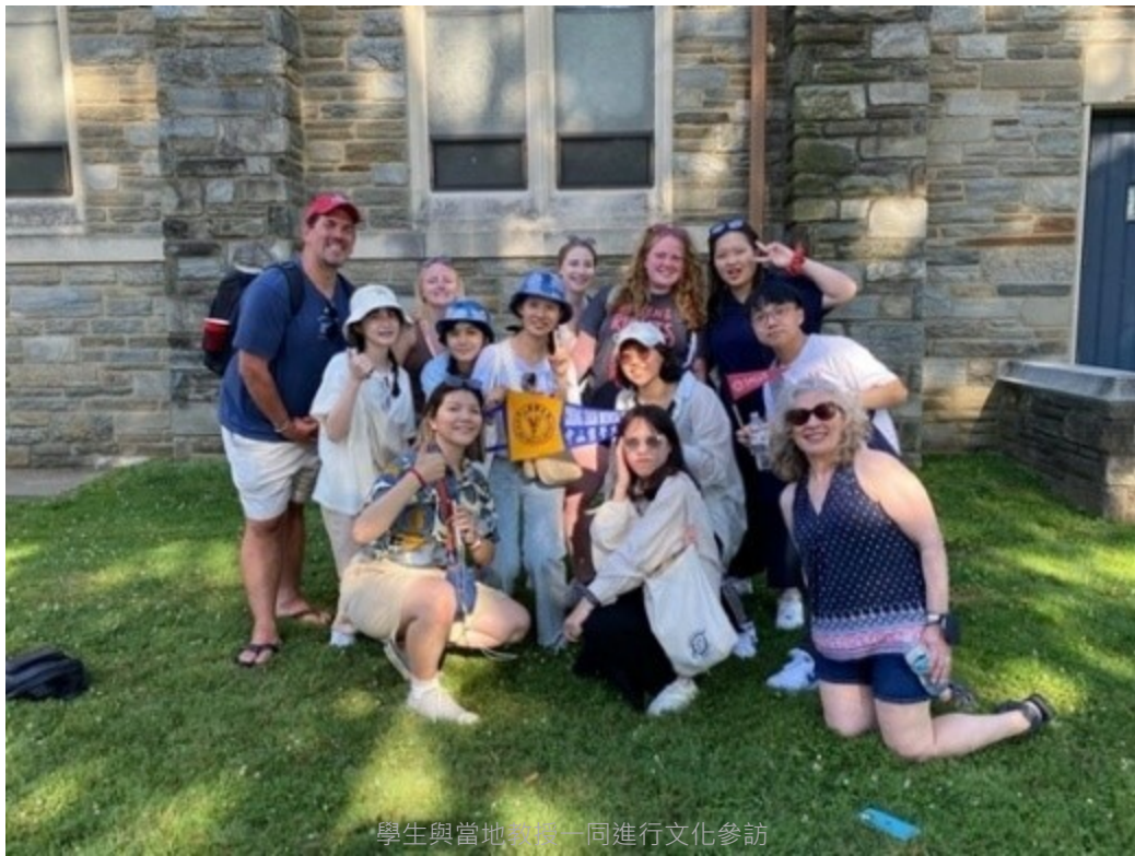
學生與當地教員一同進行文化參訪