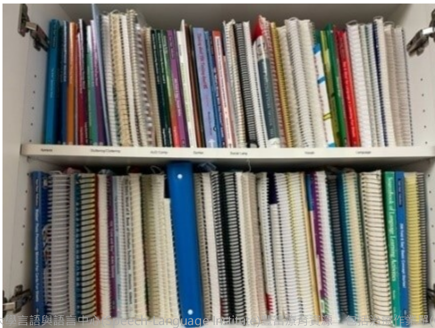
參觀薩樂斯大學言語與語言中心(Speech-Language Institute)豐富療育資源，包括作業單(worksheet)櫃