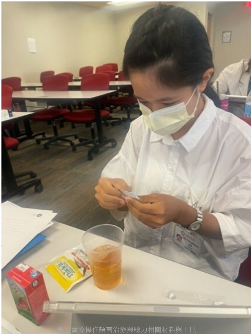
學生實際操作語言治療與聽力相關材料與工具