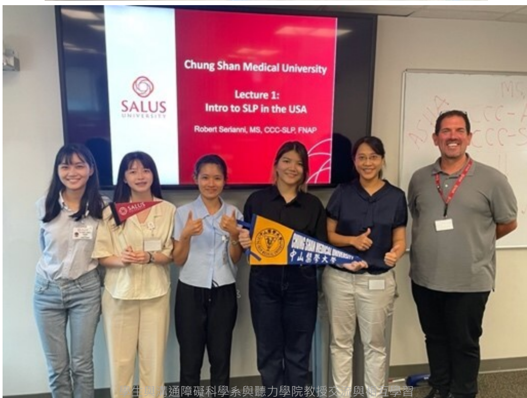
學生與溝通障礙科學系與聽力學院教授交流與相互學習