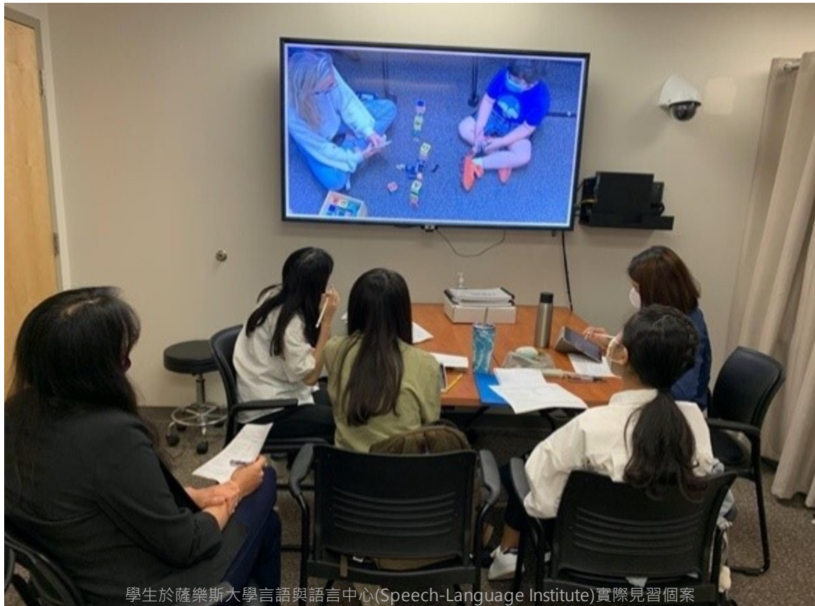
學生於薩樂斯大學言語與語言中心(Speech-Language Institute)實際見習個案