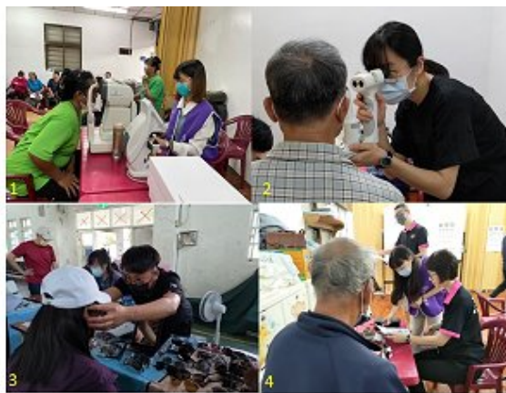
圖1:幫在地居民驗光。圖2:向醫師學習-幫在地居民檢查眼生理是否正常。圖3:幫在地居民配鏡。圖4:驗光師指導。

本次活動師生參與篩檢活動可培養學生做中學，將學校課程內容與實作訓練落實到服務社會人群，學生藉此可以累積實務經驗並觀察學習特殊需求族群的視覺功能表現，有助於與未來臨床實習及就業接軌。