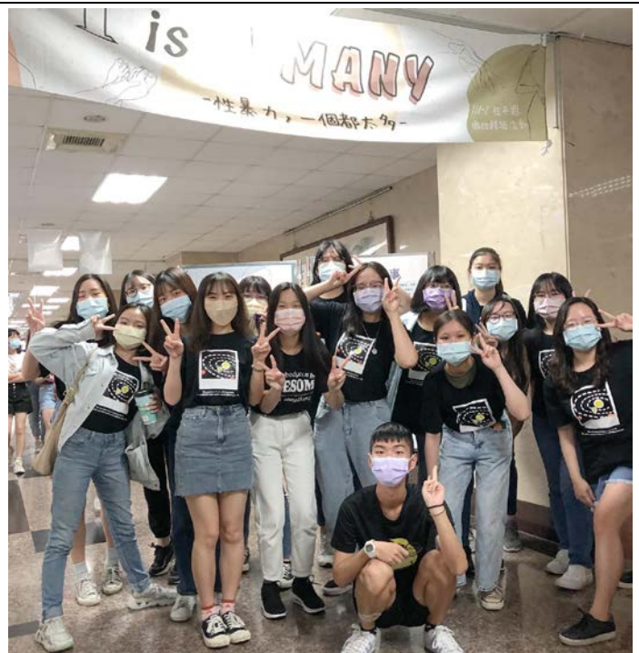
諮輔志工團大合照