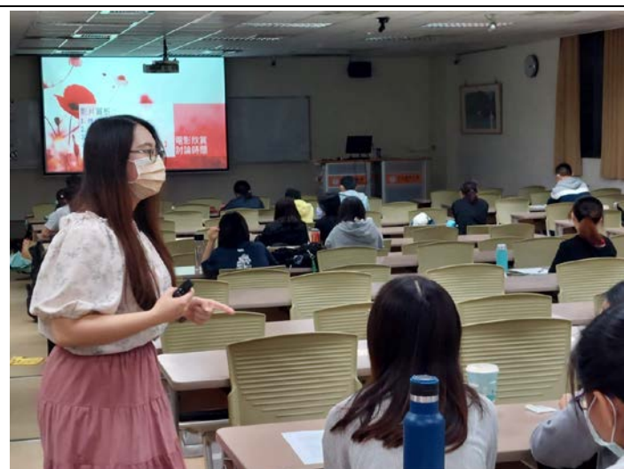
講師與同學互動過程