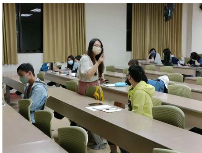
講師與同學互動過程