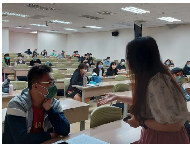
講師與同學互動過程