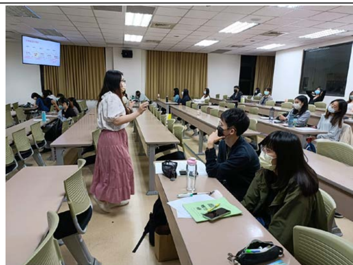
講師與同學互動過程