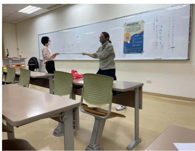
講師邀請學生示範