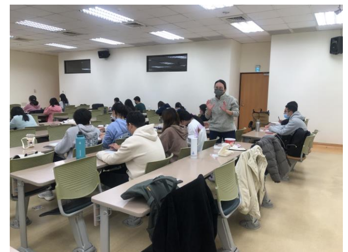
講師引導活動體驗